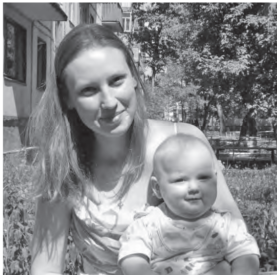
Страховые взносы за домохозяйку может уплатить муж или любой член семьи