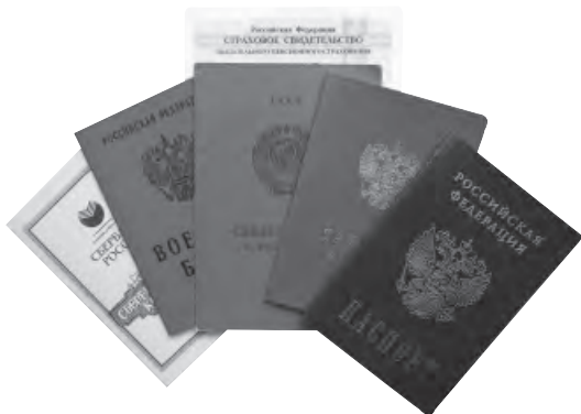
Основные документы для назначения пенсии

Признание лица, в том числе ребенка в возрасте до 18 лет, инвалидом, а также период инвалидности, дата и причина установления инвалидности, степень ограничения способности к трудовой деятельности определяются на основании выписки из акта освидетельствования в учреждении Государственной службы медико-социальной экспертизы.