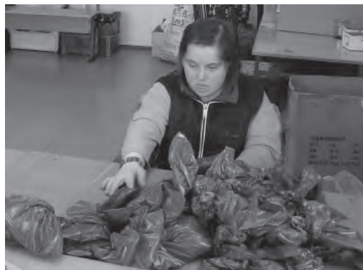
Трудовая пенсия по инвалидности имеет базовую, страховую и накопительную части

4. Дедушка и бабушка умершего кормильца, если они достигли возраста 60 и 55 лет (соответственно мужчины и женщины) либо являются инвалидами, имеющими ограничение способности к трудовой деятельности, при отсутствии лиц, которые в соответствии с законодательством Российской Федерации обязаны их содержать.