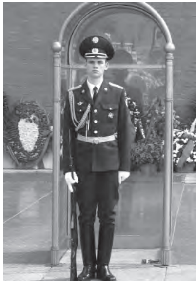
Период прохождения военной службы включается в страховой стаж