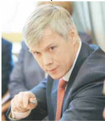
Из выступления в Госдуме депутата фракции «СПРАВЕДЛИВАЯ РОССИЯ» Валерия ГАРТУНГА.

Что касается так называемого антикризисного плана правительства, утверждённого в январе, то по