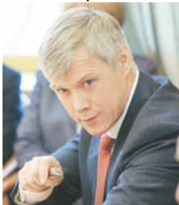
Из выступления в Госдуме депутата фракции «СПРАВЕДЛИВАЯ РОССИЯ» Валерия ГАРТУНГА.

Что касается так называемого антикризисного плана правительства, утверждённого в январе, то по