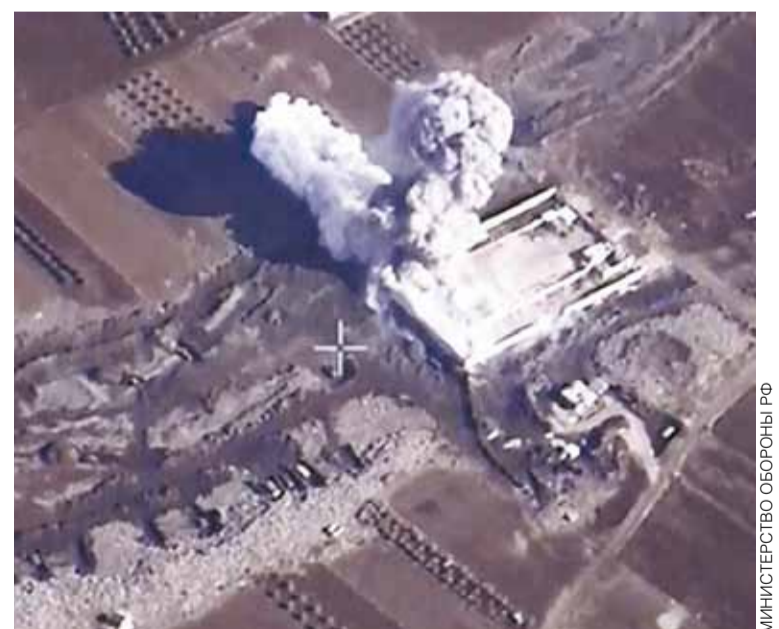
МИНИСТЕРСТВО ОБОРОНЫ РФ

Но курды научились эффективно противостоять ИГИЛ. Сирийская армия, силы народного ополчения, «Хезболла» и иранские вооружённые формирования в общей сложности составляют почти 300 тыс. человек, но они не могут даже закрыть 98 км сирийско-турецкой границы. А курды, не имея ни тяжёлого, ни серьёзного стрелкового вооружения, закрыли более 400 км этой границы. Низкая эффективность правительственной армии и поддерживающих её сил не может не вызывать беспокойства. Поэтому необходимо расширить наше военно-воздушное присутствие в Сирии, увеличивать число авианалётов по ИГИЛ.