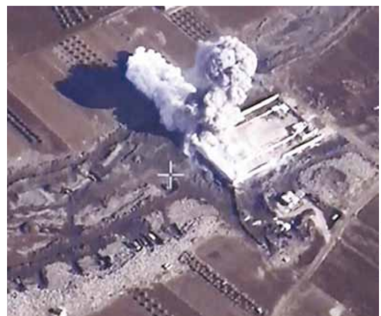
МИНИСТЕРСТВО ОБОРОНЫ РФ

Но курды научились эффективно противостоять ИГИЛ. Сирийская армия, силы народного ополчения, «Хезболла» и иранские вооружённые формирования в общей сложности составляют почти 300 тыс. человек, но они не могут даже закрыть 98 км сирийско-турецкой границы. А курды, не имея ни тяжёлого, ни серьёзного стрелкового вооружения, закрыли более 400 км этой границы. Низкая эффективность правительственной армии и поддерживающих её сил не может не вызывать беспокойства. Поэтому необходимо расширить наше военно-воздушное присутствие в Сирии, увеличивать число авианалётов по ИГИЛ.