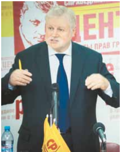
В декабре прошлого года в 21 городе России открылись Центры защиты прав граждан.

В начале 2015 года в 11 городах СПРАВЕДЛИВАЯ РОССИЯ открыла свои первые партийные Центры защиты прав граждан. Возможность обратиться за помощью тогда получили жители Казани и Нижнего Новгорода, Магадана и Белгорода, Рязани и Костромы, Новосибирска и Сыктывкара, Кургана, Воронежа и Ямала. Реальная помощь людям – это не только решение конкретных вопросов, но и бесплатные правовые консультации, профессиональные советы и предложенный алгоритм действий по защите прав и свобод. Вот почему девизом этих центров стал лозунг «В трудное время рядом с тобой!».