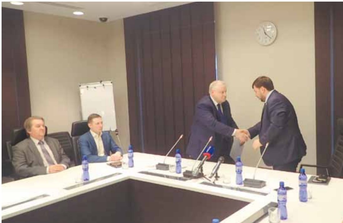
Из выступления лидера СПРАВЕДЛИВОЙ РОССИИ Сергея Миронова на встрече с руководством Народного Совета ДНР.

События, разворачивающиеся сегодня в Донбассе, являются не только результатом внутренних противоречий на Украине. Это, прежде всего, геополитический сценарий, направленный на переустройство Европы и мира на принципах неокolonизма. Мы все понимаем, что главная цель здесь – Россия. Главный заказчик – США. Главный инструмент – Украина. В этих условиях миссия ДНР и ЛНР приобретает особое значение: новые государства Донбасса становятся последним бастионом на пути распространения идеологии неокolonизма и неонацизма, передовым рубежом в борьбе за отстаивание прав всего русского мира. И в этой борьбе Россия своих не оставит.