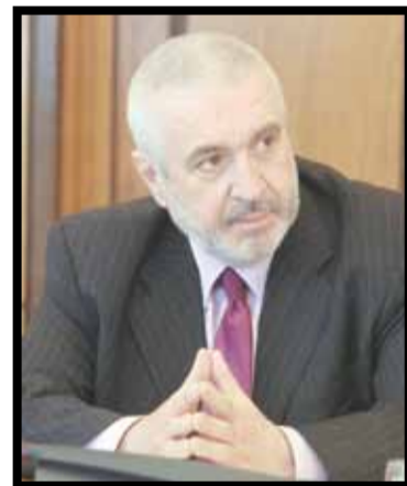
В ночь на 28 апреля в Москве после тяжёлой продолжительной болезни на 62-м году жизни скончался депутат фракции «СПРАВЕДЛИВАЯ РОССИЯ» в Государственной Думе, член Совета регионального отделения СП в Красноярском крае Валерий Михайлович Зубов.

Помните, как в связи с введением бакалаврско-магистерской системы у «реформаторов» возник проект упразднения кандидатов и докторов наук? Кандидатскую диссертацию тогда хотели приравнять к магистерской, ввести, как на Западе, степень Ph.D. Нам удалось отбиться от этих инициатив, сохранить наши кандидатские и докторские. Надеюсь, что и в случае с этой реформой аспирантуры разум возобладает, ещё не поздно внести необходимые коррективы в закон об образовании.