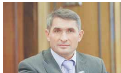
ГОСКОРПОРАЦИИ НЕЭФФЕКТИВНО ИСПОЛЗУЮТ НАРОДНЫЕ СРЕДСТВА, уверен Олег НИКОЛАЕВ, член комитета ГД по бюджету и налогам:

В сумме получается, что «Сколково» не развивает, а губит науку, ведь в стране есть два сорта инновационных организаций – прикормленные государством и им же брошенные. Говорят, что даже при самой уничтожающей критике проект не закроют, чтобы не портить репутацию премьеру Дмитрию Медведеву, который подписывал указ об открытии инновационного центра.